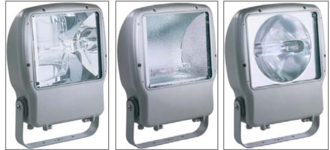
A fényforrás nem tartozéka a lámpatestnek. Light sources not included.